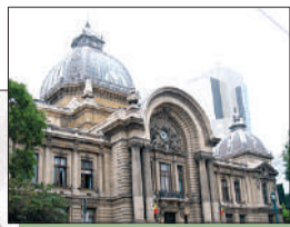
Palatul CEC (1875)

10 mai 1866, când principele Carol a sosit la București, a devenit ziua dinastiei. În 1870 a fost la un pas de a renunța la tron, copleșit de balcanismul societății românești. Dar s-a răzgândit, hotărând să o domine. În cei 48 de ani de domnie, el a adus schimbări radicale în viața statului român. Moralitatea impecabilă și stilul său exact au determinat-o pe regina Elisabeta să spună despre soțul ei că „și în somn poartă Coroana pe cap“.